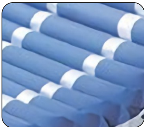
Colchón de Nylon/PVC.