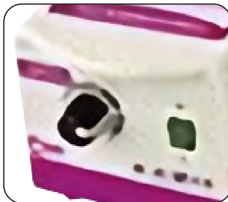
Regulador en función de peso.