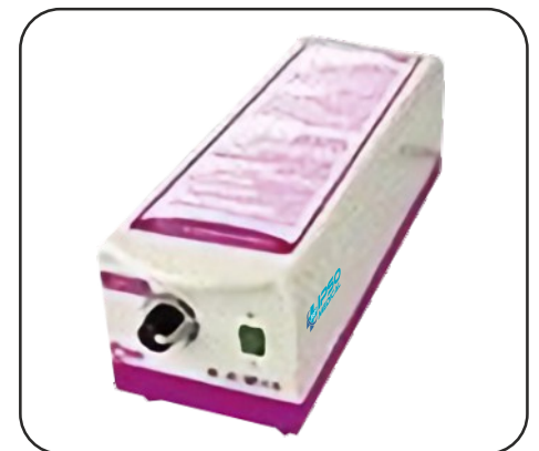
Compresor fácil de colocar.